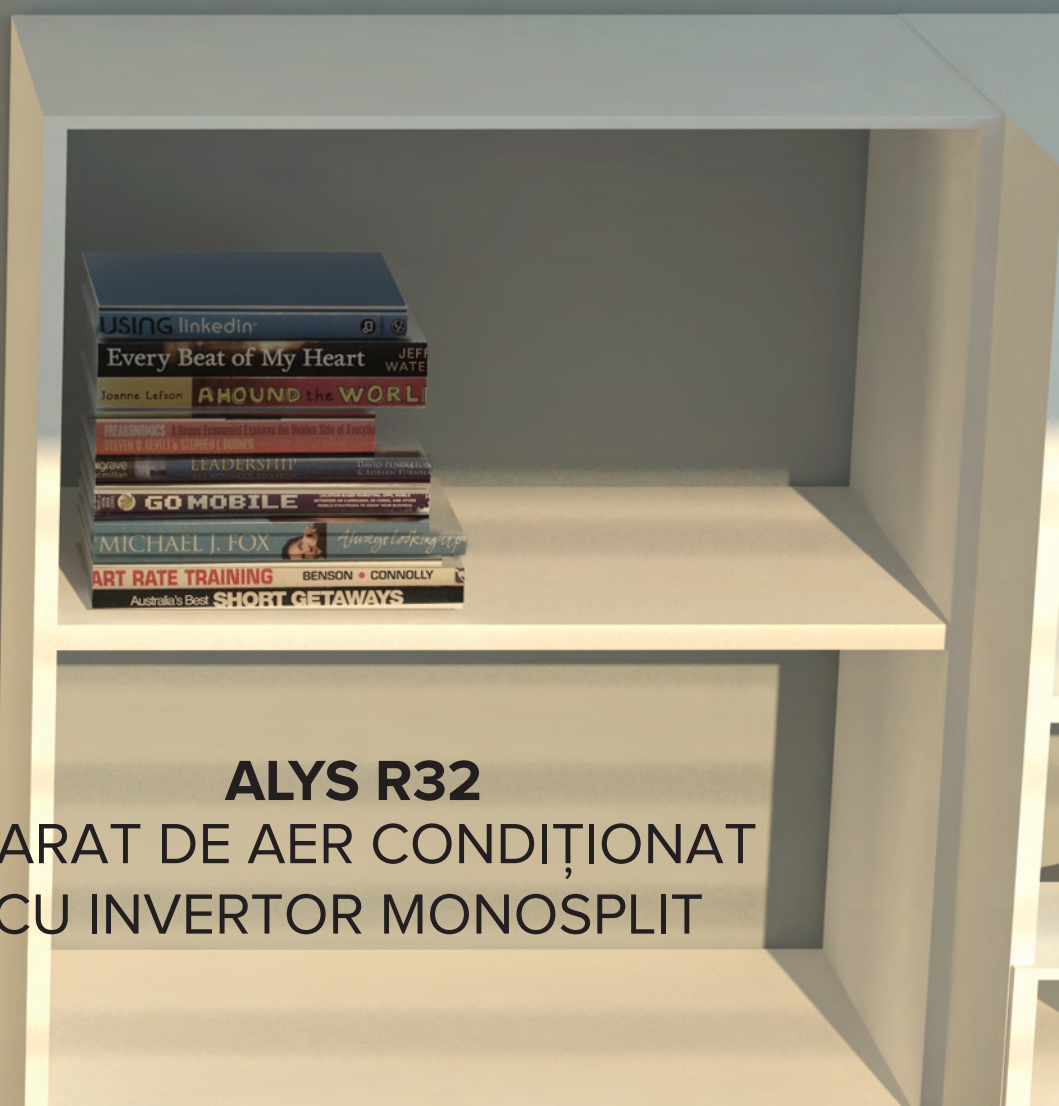
ALYS R32 APARAT DE AER CONDIȚIONAT CU INVERTOR MONOSPLIT